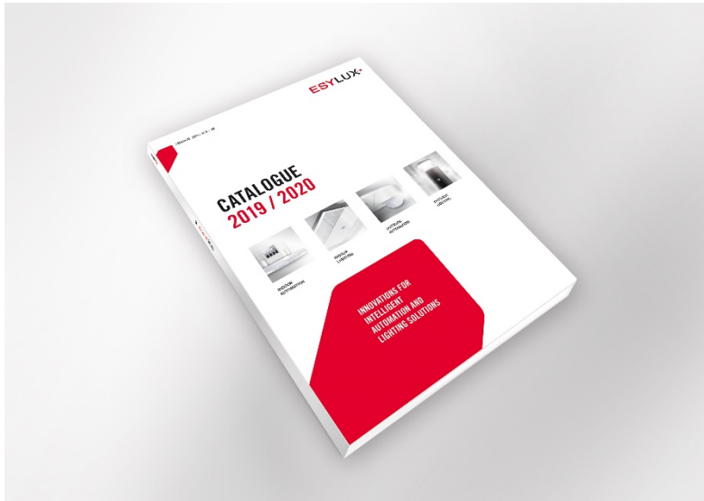
Catálogo ESYLUX 2019/2020